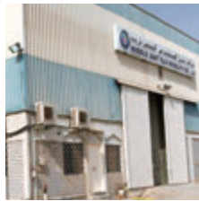
Middle East Fuji Khimji's Co. LLC