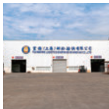
Fuji Marine Logistics Shunyang (Shanghai) Co., Ltd.