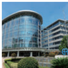
Fuji Trading (Shanghai) Co.,Ltd.