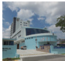
Fuji Trading (Singapore) Pte.,Ltd. Fuji Horiguchi Engineering Pte.,Ltd.