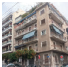
Fuji Trading Co., Ltd. Greece Office