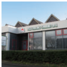
Fuji Trading (Marine) B.V.