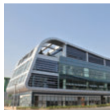
Hanil-Fuji (Korea) Co.,Ltd. Fuji Global Logistics Co.,Ltd.